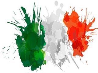
La rivoluzione liberale Pietro Gobetti